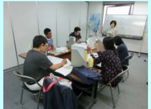
日本語の授業の様子