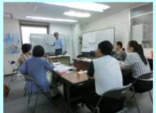
仕事の紹介の様子