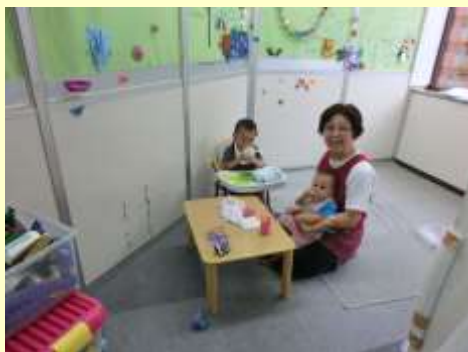
子どものための部屋