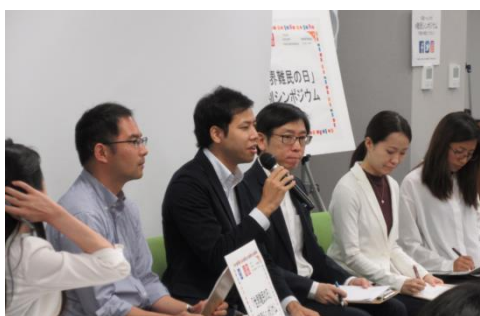
パネル・ディスカッションでは様々なテーマが議論されました