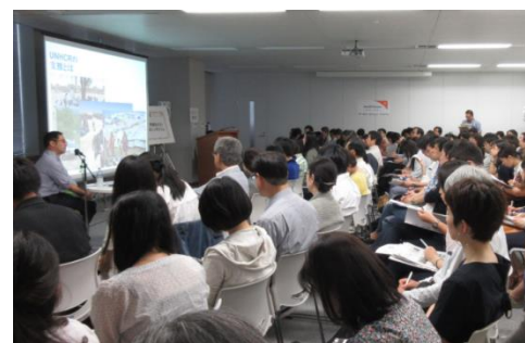
定員を超える約120人が来場