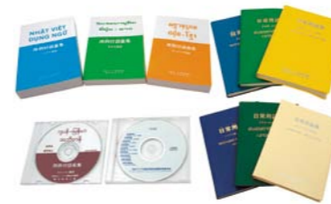
難民事業本部が開発した日本語教材 (用例付語彙集、日常用語集)

地域で暮らす難民定住者が継続して日本語を学ぶことができるよう、難民事業本部で開発した日本語教材等の援助を行っています。また、難民定住者に日本語の学習指導を行っている日本語ボランティア団体の活動や運営に関する助言や支援を行っています。RHQ支援センターと関西支部では、日本語教育相談員が難民定住者や日本語ボランティア団体・学校・事業所等からの日本語学習に関する相談に応じています。