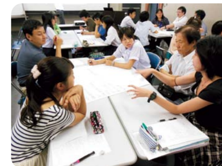
2015年6～7月開催 「ワークショップ難民」

難民問題の専門家及びボランティアを育成し、また、難民支援分野でのNGOとの連携を進めるため、難民問題に関するセミナーなどを催しています。さらに、広く難民問題について理解を求めるための「難民理解講座」も開催しています。